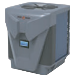
SMART HEAT 115SH