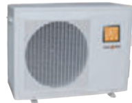
PLUS 13P | 26P | 47P