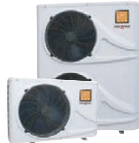
SUPREME 80S | 105S