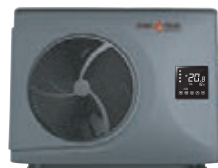
SMART HEAT 65SH